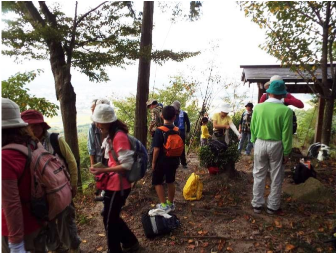
●童男卍女岩 ふれあい広場で休憩