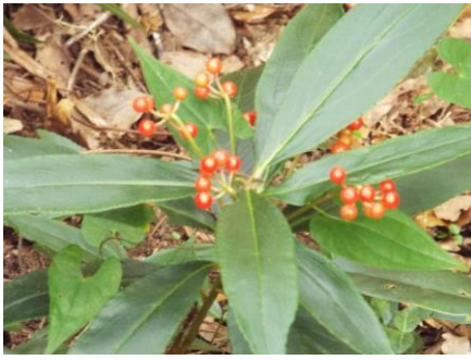
●カラタチバナ (別名：百両)